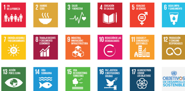
Imagen 4. Objetivos de Desarrollo Sostenible.

El día 25 de septiembre del año 2015 se aprobó en la Organización de Naciones Unidas la Agenda 2030 y los 17 Objetivos de Desarrollo Sostenible (ODS) que pueden ser definidos como metas a lograr por los diferentes estados y naciones a fin de aspirar al desarrollo sostenible humano y a la dignidad de las personas, con independencia de su origen, condición, situación... La aspiración política es llegar al 0, cero pobreza, cero desigualdad, cero contaminación... Los gobiernos, la sociedad y el sector público-privado deben trabajar conjuntamente para lograr tales objetivos: dignificar a la España Vacía sería un tema transversal.