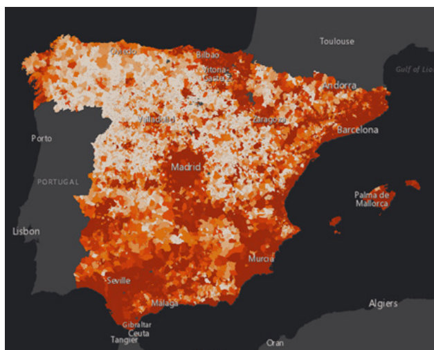
Imagen 2. Cuanto más naranja, mayor pérdida de población.

pital generado a través de la acción humana y productiva. Paralelamente al proceso evolutivo del sistema productivo capitalista, se han ido generando numerosas brechas entre los dos contextos citados, beneficiando al urbano en detrimento al rural, situación que agrava las desigualdades sociales que tiene como epicentro la lucha de clases.